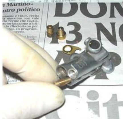
Getto del minimo dopo averlo svitato dal fondo del tubicino